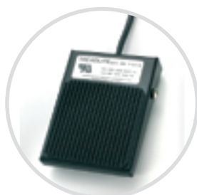
Pedal de control ergonómico