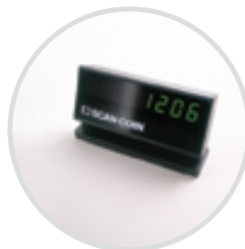
Pantalla externa opcional